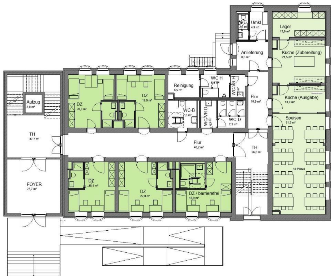
Erdgeschoss: Doppelzimmer und Speiseraum